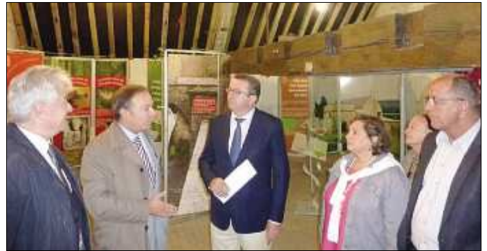
TOITURE. Christian Paul est venu constater, entre autres, les travaux de rénovation d'une partie de la couverture du musée Forges et Marines, en présence des élus et du président des AVG.

Après la récente visite préfectorale (notre édition du 2 septembre), c'était au tour du député Christian Paul, samedi matin, de venir apprécier l'exposition du musée Forges et Marines.