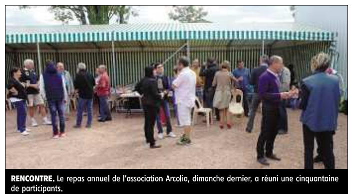
RENCONTRE. Le repas annuel de l'association Arcolia, dimanche dernier, a réuni une cinquantaine de participants.

Arcolia a également participé au comice rural, fin