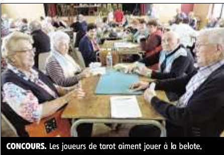
CONCOURS. Les joueurs de tarot aiment jouer à la belote.